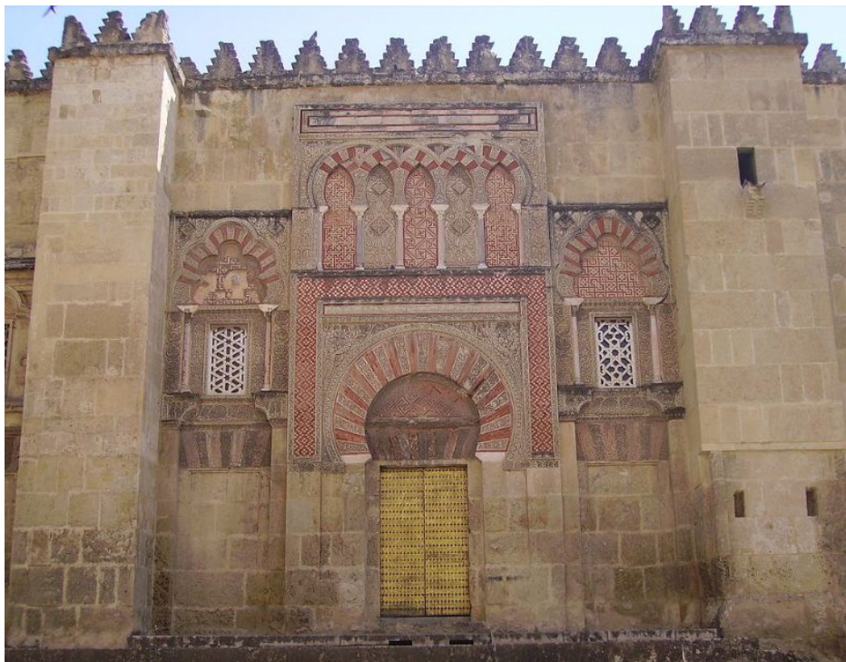
Foto 2: