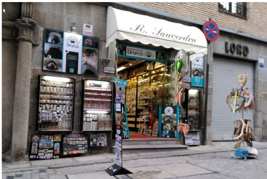
Foto 1: Por El Pozo de los Deseos http://visitaelpozodelosdeseos.com/

Foto 2: Por El Pozo de los Deseos http://visitaelpozodelosdeseos.com/