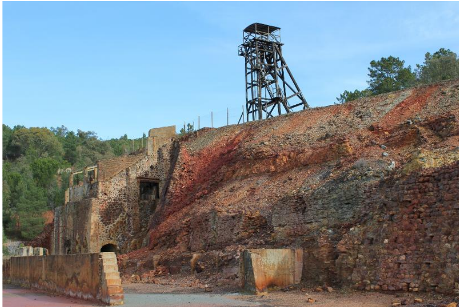
Foto 1: Río de sangre

Foto 2: