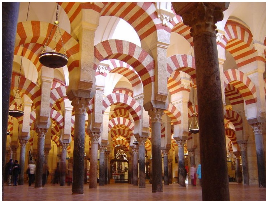
La mezquita se encuentra en la calle Cardenal Herrero, 1. Córdoba. España.