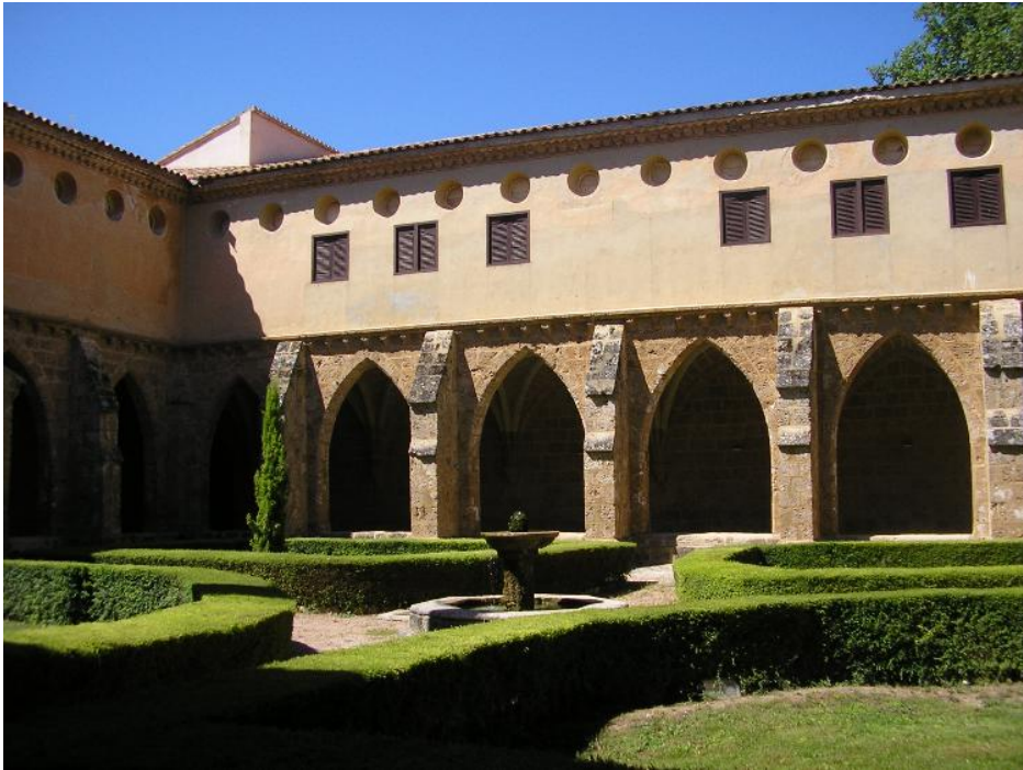
Foto 4: