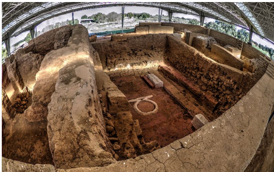
Carretera EX-114, Km 3. Zalamea de la Serena, Badajoz (Extremadura)